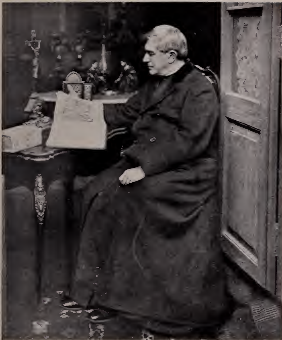
MONSEÑOR PABLO CABRERA EN 1927.